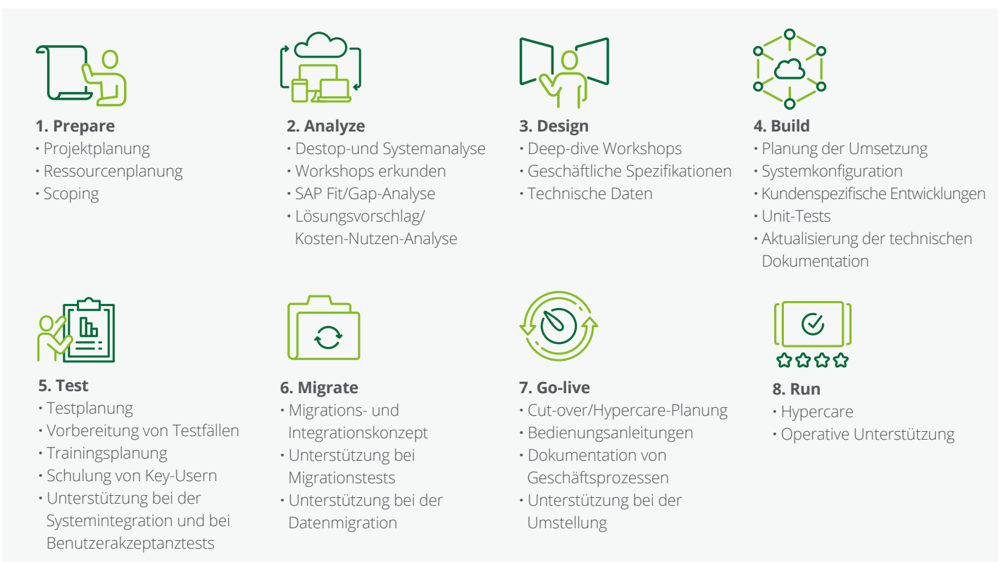
Abb. 2 – Adaptierbares Vorgehensmodell

sen anbieten können. Unser Dienstleistungsspektrum erstreckt sich dabei von der reinen Beratung, über die Implementierung der Standardlösung und der Entwicklung kundenspezifischer Lösungen bis hin zum operativen Betrieb.